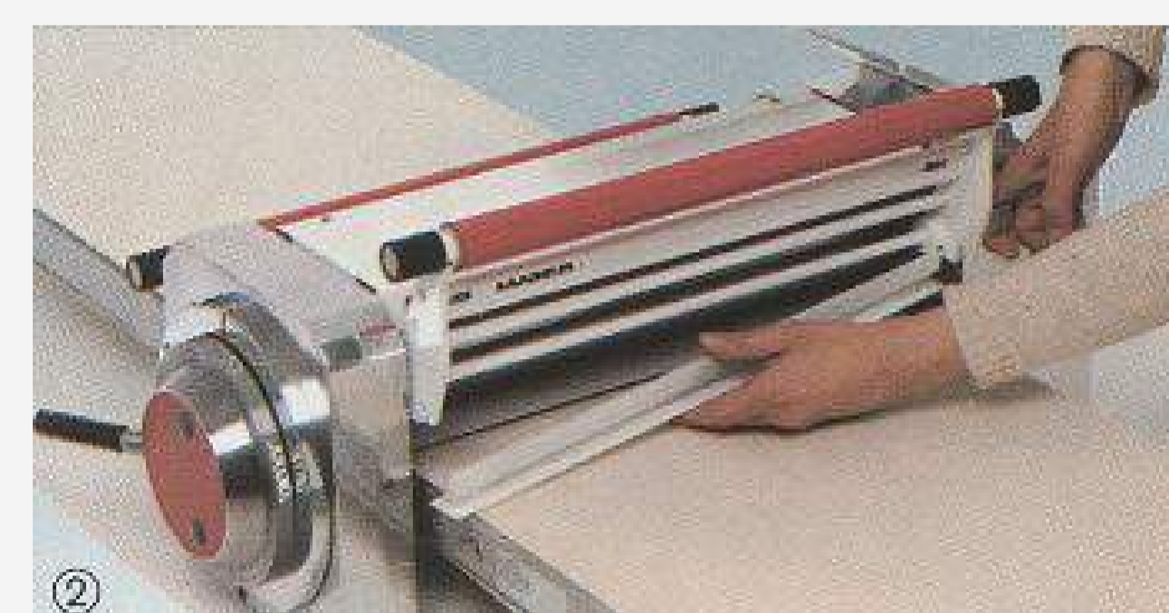
Figure 2: Juwel 5005 M/K